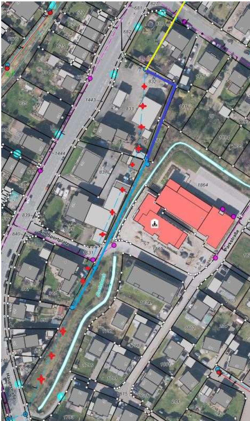
Abbildung 1: Aufgabe Alttrasse rote Markierungen, Umlegung dunkelblaue Trasse, unberührter Bestand hellblau